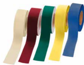
Nouveaux accessoires : Stamcoll Tape

Les couleurs d'impression peuvent différer des couleurs réelles de la gamme de Stamisol FA POP et n'ont qu'un caractère informatif (échantillons des couleurs sur demande)