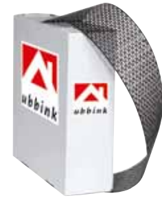
Rouleau de ventilation d'égout